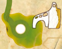
Paraje Natural de la Magdalena Paratge Natural de la Magdalena