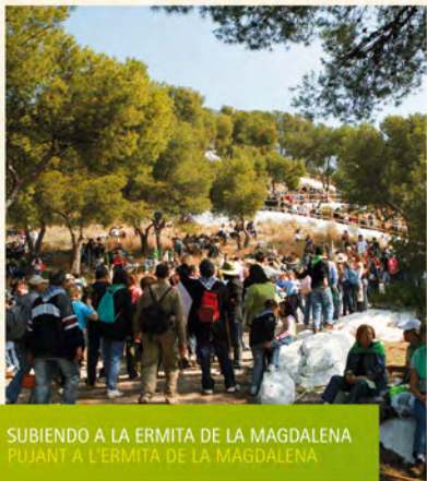
SUBIENDO A LA ERMITA DE LA MAGDALENA PUJANT A L'ERMITA DE LA MAGDALENA