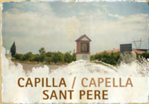
CAPILLA / CAPELLA SANT PERE