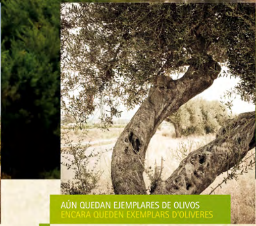
AÚN QUEDAN EJEMPLARES DE OLIVOS ENCARA QUEDEN EXEMPLARS D'OLIVERES