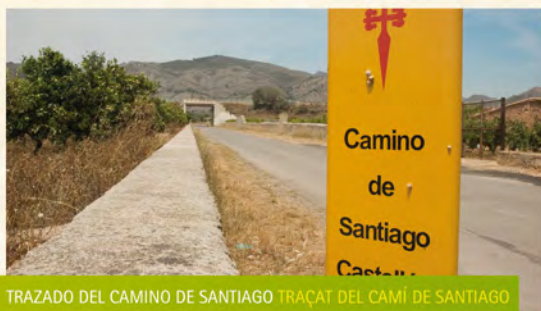
TRAZADO DEL CAMINO DE SANTIAGO TRACAT DEL CAMÍ DE SANTIAGO