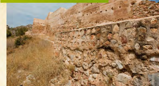
EL CASTELL VELL. EL ORIGEN DE CASTELLÓN EL CASTELL VELL, L'ORIGEN DE CASTELLO