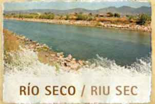
RÍO SECO / RIU SEC