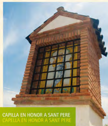
CAPILLA EN HONOR A SANT PERE CAPELLA EN HONOR A SANT PERE