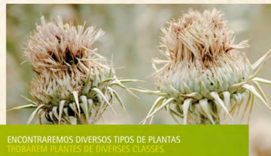
ENCONTRAREMOS DIVERSOS TIPOS DE PLANTAS TROBAREM PLANTE DE DIVERSES CLASSES.