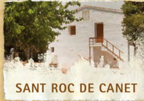
SANT ROC DE CANET