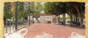
PZA. PRIMER MOLÍ

Límite urbano de la ciudad de Castellón Límit urbà de la ciutat de Castelló