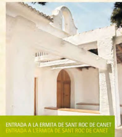
ENTRADA A LA ERMITA DE SANT ROC DE CANET ENTRADA A L'ERMITA DE SANT ROC DE CANET