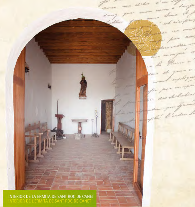
INTERIOR DE LA ERMITA DE SANT ROC DE CANET INTERIOR DE L'ERMITA DE SANT ROC DE CANET