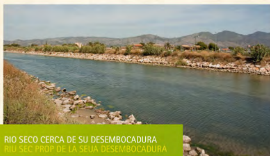
RIO SECO CERCA DE SU DESEMBOCADURA RIU SEC PROP DE LA SEUA DESEMBOCADURA