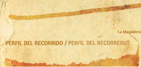
PERFIL DEL RECORRIDO / PERFIL DEL RECORREGUT

Límite urbano de la ciudad de Castellón Límit urbà de la ciutat de Castelló