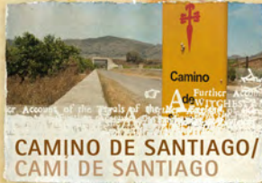
CAMINO DE SANTIAGO/ CAMI DE SANTIAGO