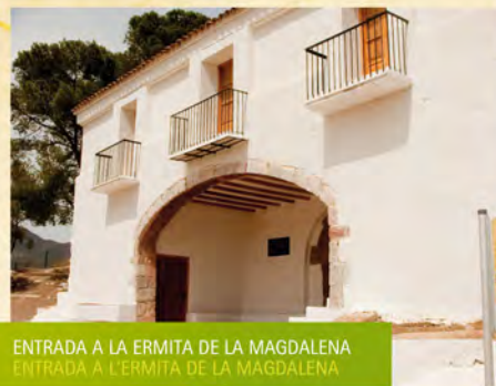
ENTRADA A LA ERMITA DE LA MAGDALENA ENTRADA A L'ERMITA DE LA MAGDALENA