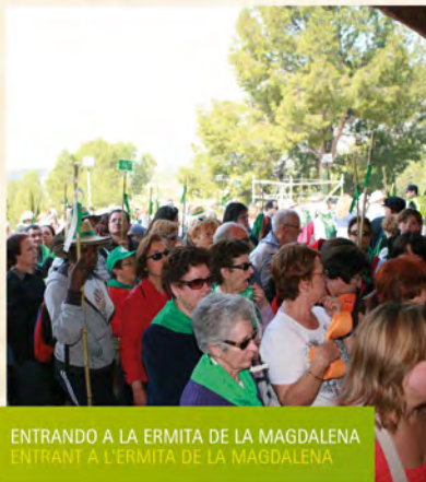
ENTRANDO A LA ERMITA DE LA MAGDALENA ENTRANT A L'ERMITA DE LA MAGDALENA