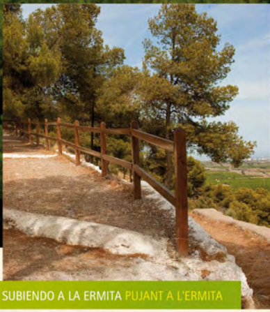
SUBIENDO A LA ERMITA PUJANT A L'ERMITA