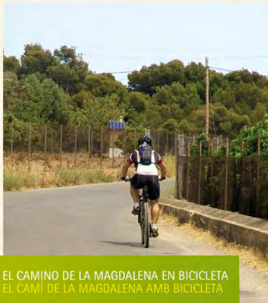
EL CAMINO DE LA MAGDALENA EN BICICLETA EL CAMÍ DE LA MAGDALENA AMB BICICLETA