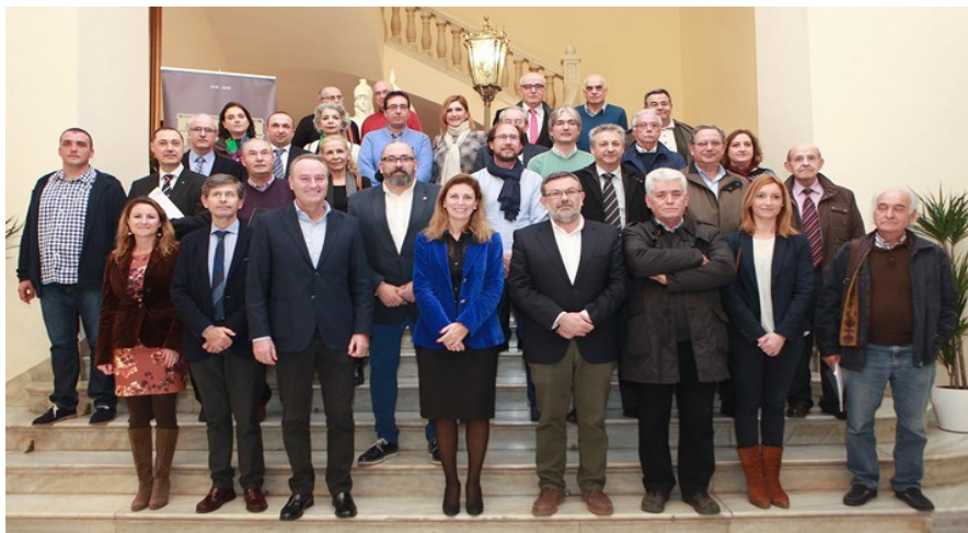
Foto de la sessió constitutiva del Ple del Consell del 27 de gener de 2016

La composició del Ple del Consell és la que s'estableix en l'article 7 del mencionat Reglament, en què estan les principals organitzacions socials, professionals i de veïns més representatives i d'aquelles institucions més rellevants amb seu a la ciutat.