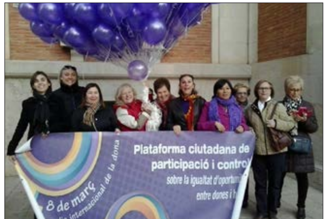
La manifestació del 8 de Març va convocar nombrosos col·lectius