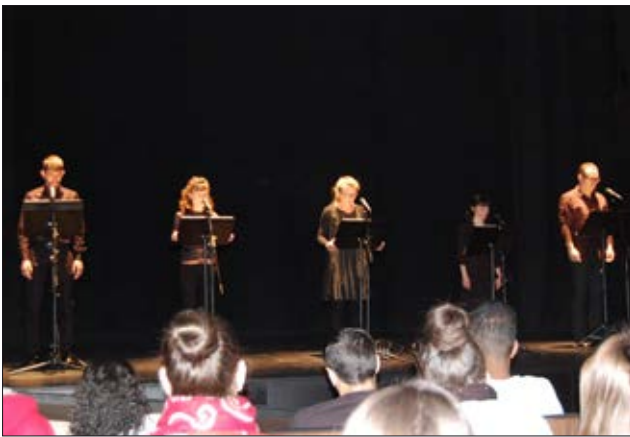
L'obra Passos Lleugers -l'objectiu de la qual és sensibilitzar contra la violència de gènere- es va intepretar davant d'alumnat d'IES de Castelló i públic general