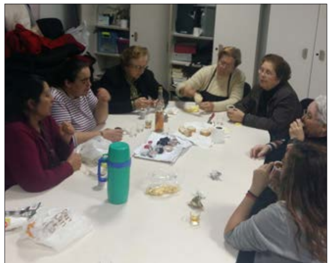
Les Dones de Sant Llorenç també celebraren el 8 de Març