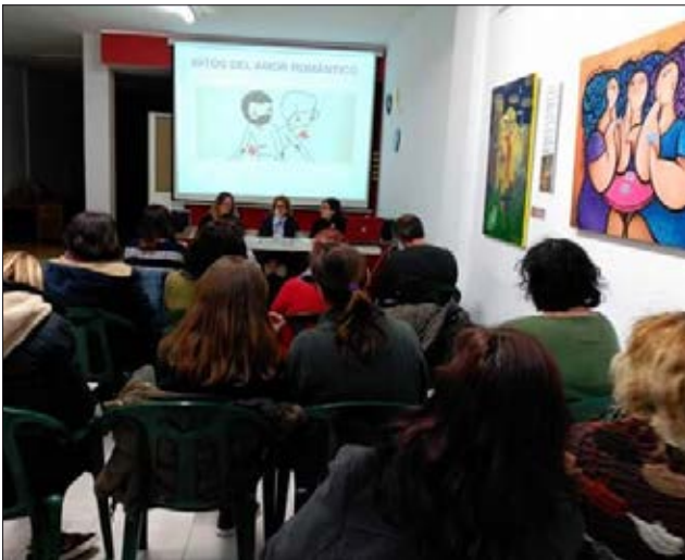
La Flama organitzà diverses xerrades al voltant del 8 de Març