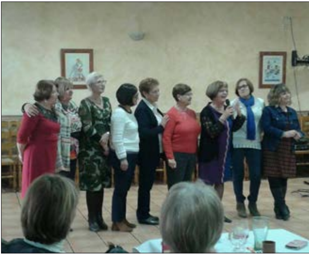
Les dones de 8 de Març van celebrar el dinar de germanor