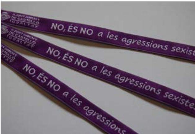
La Regidoria d'Igualtat va repartir polseres contra les agressions sexuals en les Festes de la Magdalena