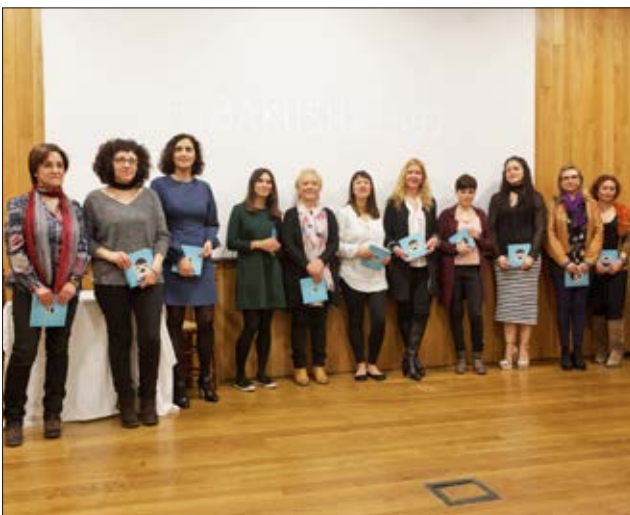
Imatge de la inauguració de Mnemòsines, de Adona't