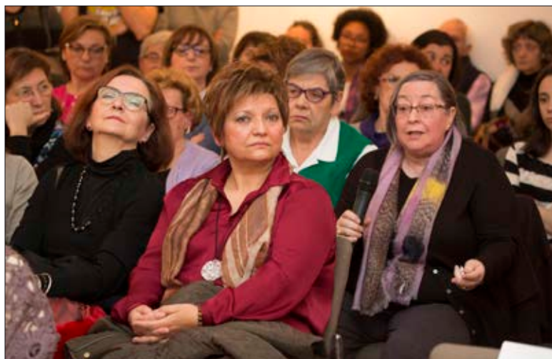
Presentació del documental "Feministes de Castelló en la transició"

L'Associació de Dones 8 Març va celebrar el tradicional dinar de germanor entre totes les sòcies i l'Associació de Dones Sant Llorenç també es va reunir amb motiu del 8 de Març.