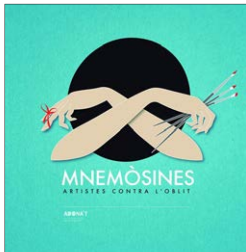
Cartell de l'exposició d'Adona't, "Mnemòsines, artistes contra l'oblit"